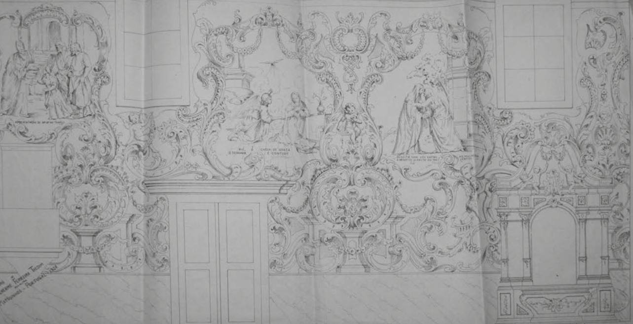
Figura n.º 2 – Desenho do lado da Epístola (Igreja Matriz de Válega), Oficinas de Guilherme Ferreira Thedim – escultor – Matosinhos, Portugal, 1958.