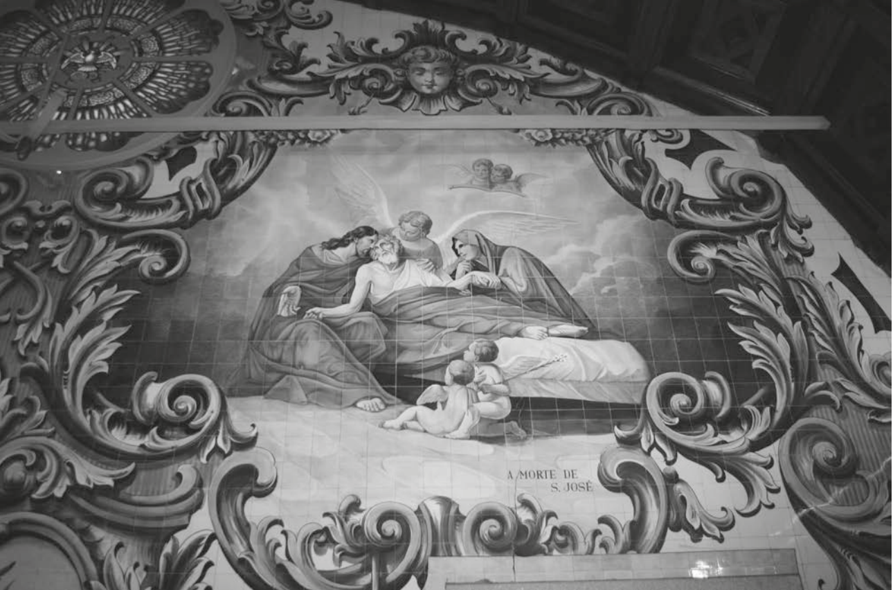
A MORTE DE S. JOSÉ