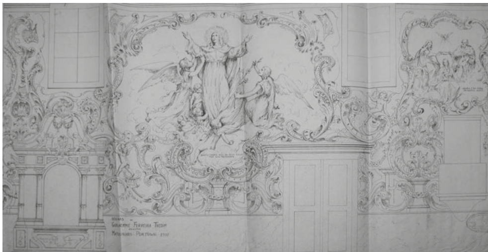
Figura n.º 5 – Desenho do lado do Evangelho (Igreja Matriz de Válega). Oficinas de Guilherme Ferreira Thedim, escultor, Matosinhos, Portugal, 1958.

Tomai o corpo de minha Mãe, levem-no ao vale de Josafat, coloquem-no num sepulcro novo que ali encontrareis e não vos movereis daquele lugar até que eu chegue, que será daqui a três dias. Assim, depois disso, o arcanjo Miguel entregou a alma de Maria a Jesus, que [...] a tomou em suas mãos e disse: Levanta-te, Mãe minha, senhora minha, tabernáculo da glória, vaso da minha vida, templo celestial, levanta-te! Levanta-te, porque esse santíssimo corpo teu que sem cópula carnal e sem mancha de qualquer tipo de concupiscência concebeu o meu, merece estar imune da desintegração que se produz no sepulcro! 45