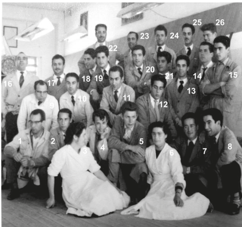
Figura n.º 1 – Trabalhadores da secção de painéis da Fábrica Aleluia.

Na figura que se segue, estão nove desses elementos, identificados na respetiva legenda com os números 1, 4, 9, 13, 16, 18, 21, 24 e 26.